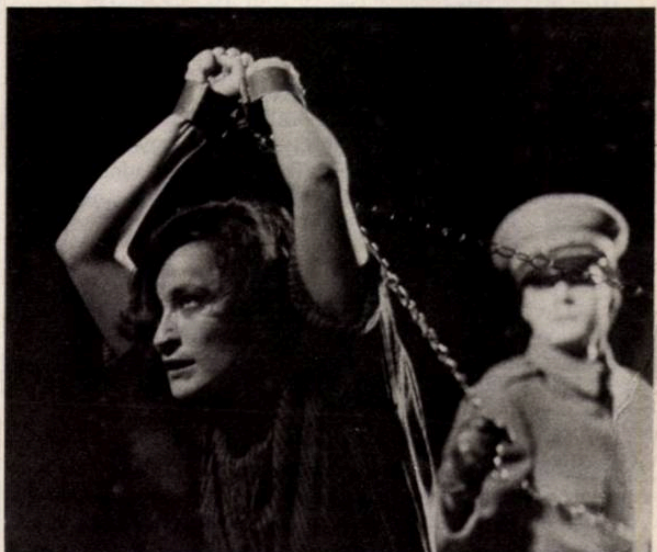
Az Antigoné rendelésre íródott: Tragédia magyar nyelven Szophoklész Antigonéjából (Várszínház, Refektórium, rendező: Csiszár Imre)