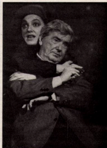
A tanítvány viaskodása Lukács György szellemével: Az interjú (Játékszín, rendező: Babarczy László)